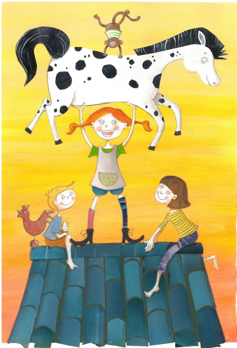
Illustrazione di Živa Pahor