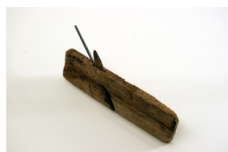
Plana Pialla per sagomature