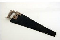
Pilica Saracco Žaga