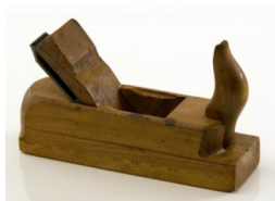
Plana Pialla Obliča